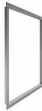
Cornici di finitura in ABS per entrambi i lati