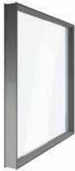
Vetro 33.1 stratificato antifortunistico, già inserito nel telaio in ABS