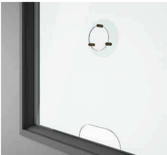
PASSACARTE + OBLÒ + PARAFIATO