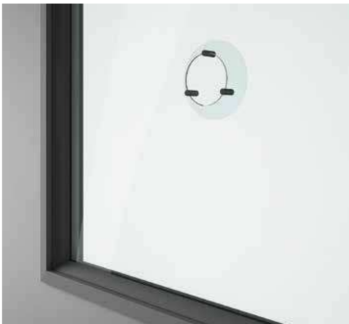
OBLÒ + PARAFIATO