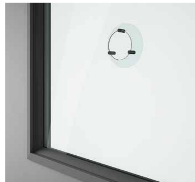
OBLÒ + PARAFIATO