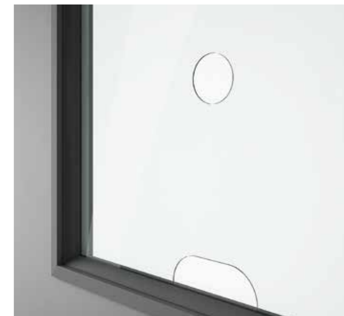
PASSACARTE + OBLÒ