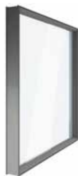
Vetro 33.1 stratificato antinfortunistico, già inserito nel telaio in ABS