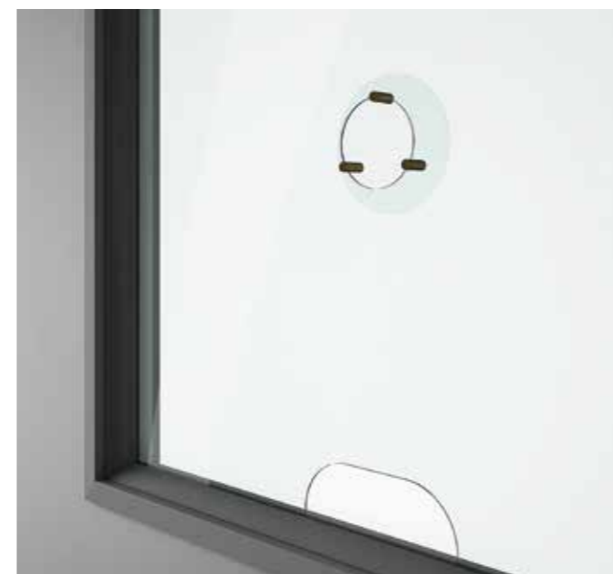
PASSACARTE + OBLÒ + PARAFIATO

Disponibile, con sovrapprezzo, su tutte le dimensioni del modulo vetrato trasparente