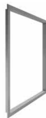
Cornici di finitura in ABS per entrambi i lati